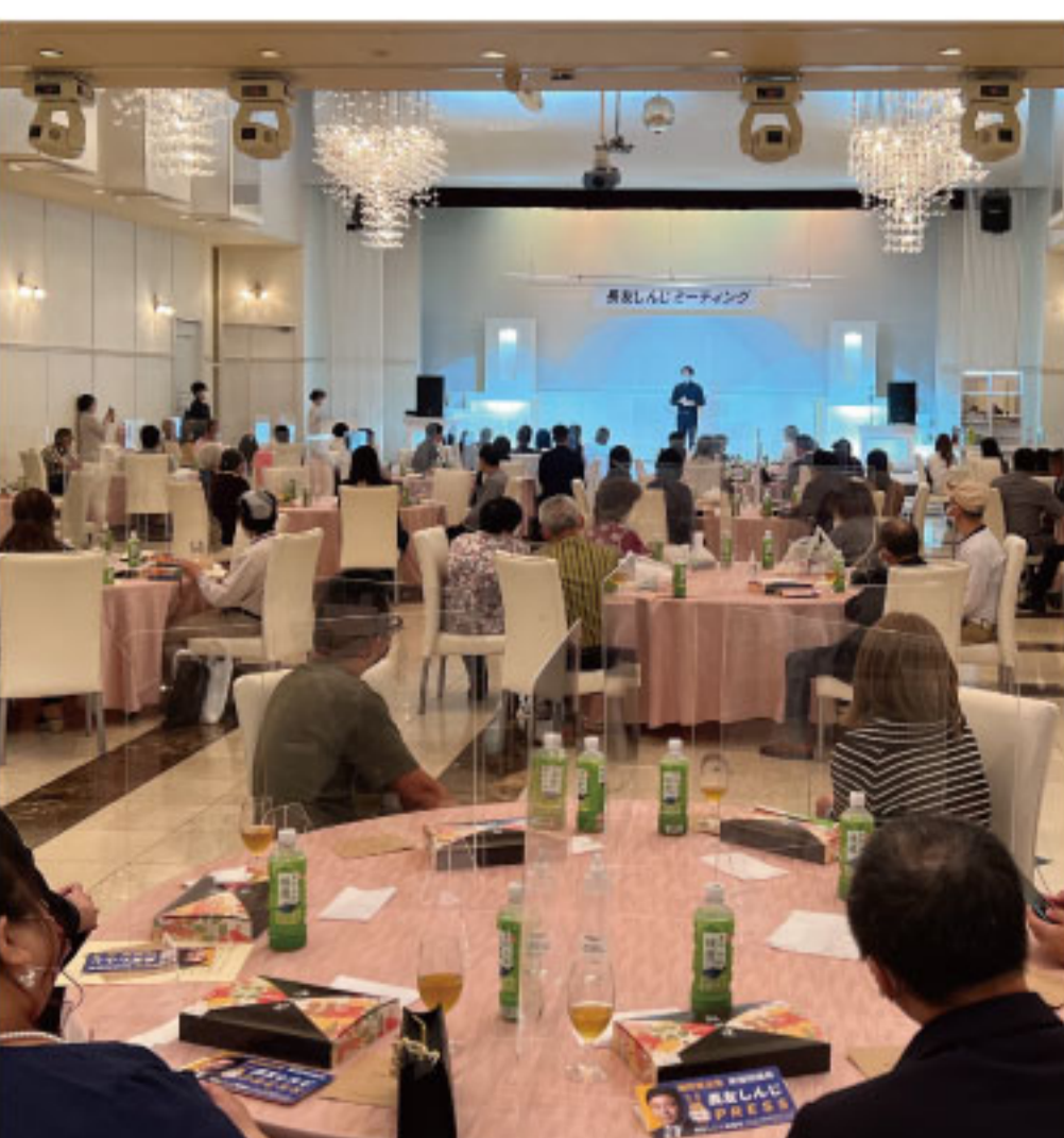
▲立派な会場をご用意いただきました ▶玉木代表からのメッセージは動画で